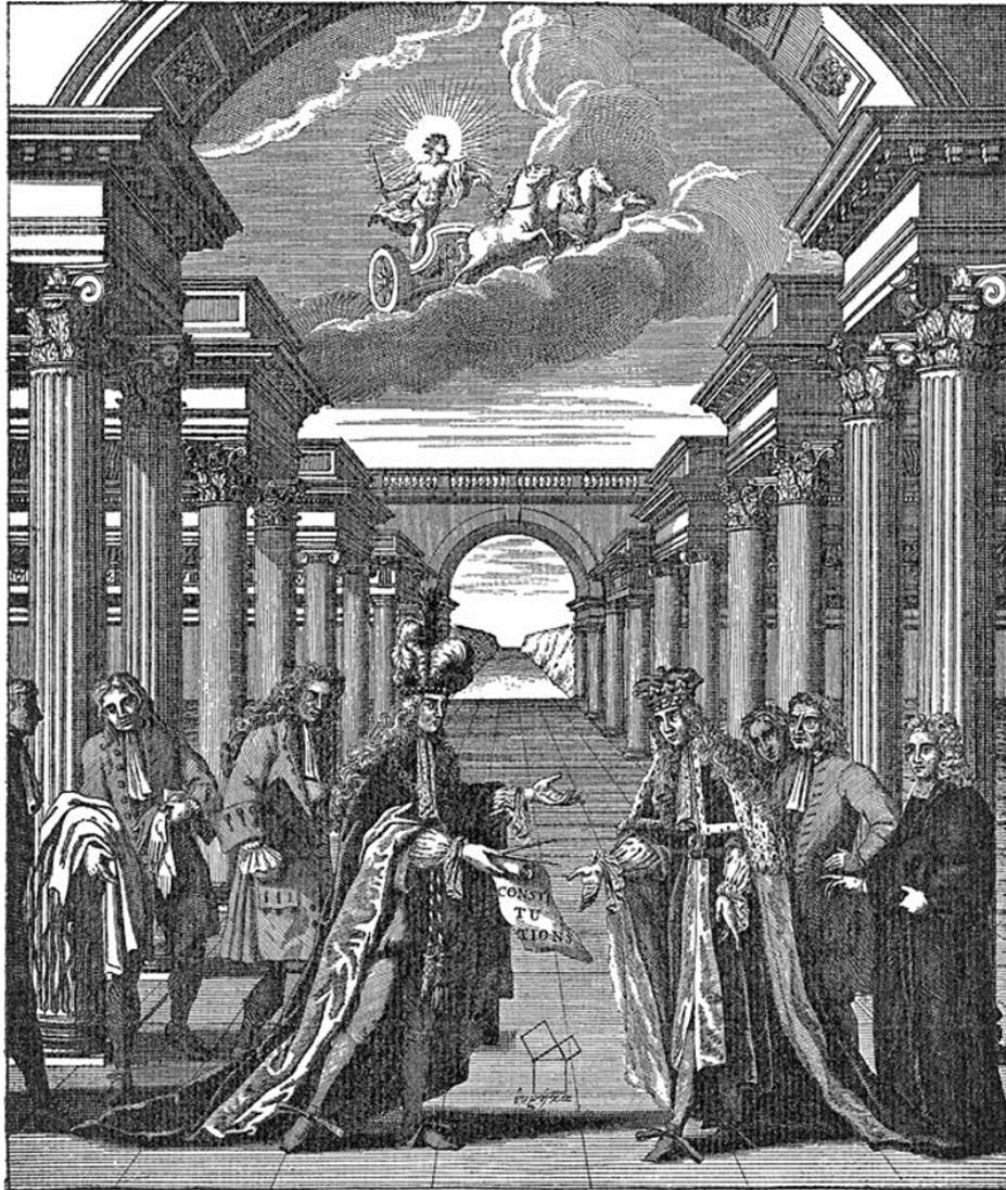
Engraving by John Pine in Aldersgate Street London

Op Zomer Sint Jan 1717 besluiten vier Londense Loges hun krachten te bundelen in een grootloge, de grootloge van Westminster, die uit zou